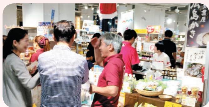
広島フェア開催の様子

海外販路開拓、調査・ マーケティング、コンサル ティングで新たな市場 開拓を支援します。