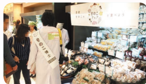
きのごフェア開催の様子