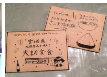
宮城県水産品試食懇親会の様子