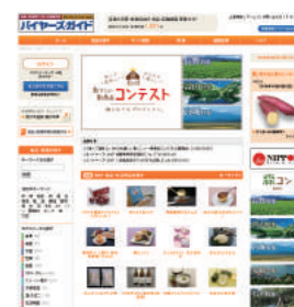
WEBサイトトップページ