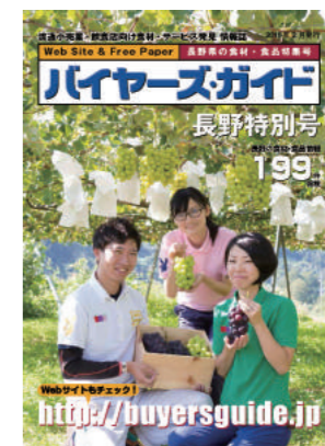
フリーペーパー表紙、中身