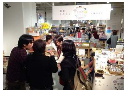
きのこフェア開催の様子