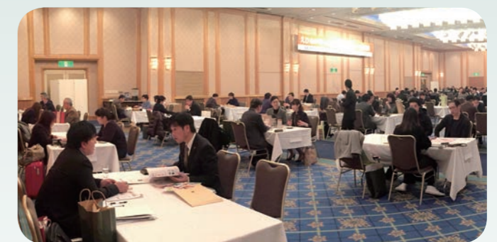
愛媛県での商談会の様子