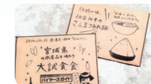
宮城県水産品試食懇親会の様子