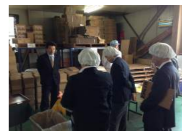
バスツアーの様子