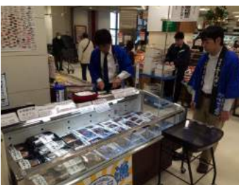
宮城県フェア開催の様子